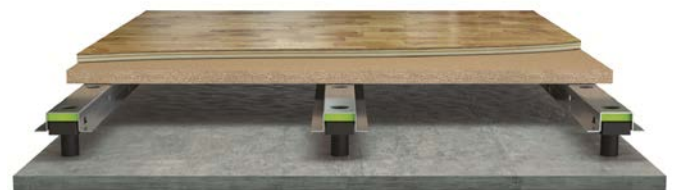
Fig. 2 Granab tilfarersystem, versjon 3000N12 (12 mm dempelement). Prinsipptegning av versjon 3000N med montert 22 mm golvspionplate og hulrom for eventuell føring av installasjoner.