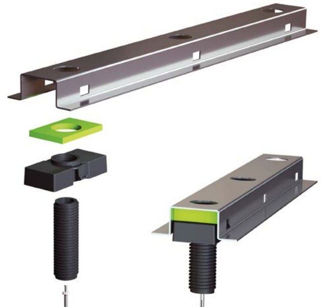
Fig. 1 Granab tilfarersystem, versjon 3000N12 (12 mm dempelement). Figuren viser de ulike komponentene: nivåjusteringsskruer, stålprofiler, støtteklosser og dempelementer sammensatt og oppdelt. Det er samme prinsipp for versjon 7000N og 9000N, men stålprofil og dempelementer varierer.

Tilfarersystemet er beregnet for montering av lastbærende golvspionplater på byggeplass. Sponplatene og tilhørende festemidler omfattes ikke av godkjenningen. Det forutsettes at lim og sponplater følger norske krav (DOK) til produktdokumentasjon og miljøegenskaper.